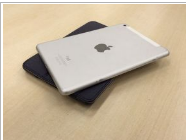
実証実験ではiPadだったが…(イメージ)

PR 大人のFX投資とは？慌てず、急がず一日数回チェックでFXは投資に→ PR 新宿駅に直通9分。広大な公園に隣接した全11邸の戸建邸宅街が誕生。 PR どの株を買うべきか分からない？そんなあなたに【マネックスシグナル】